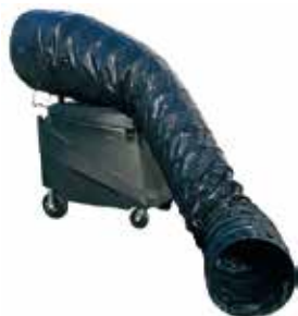
フレキシブル ダクトキット 600-039-A