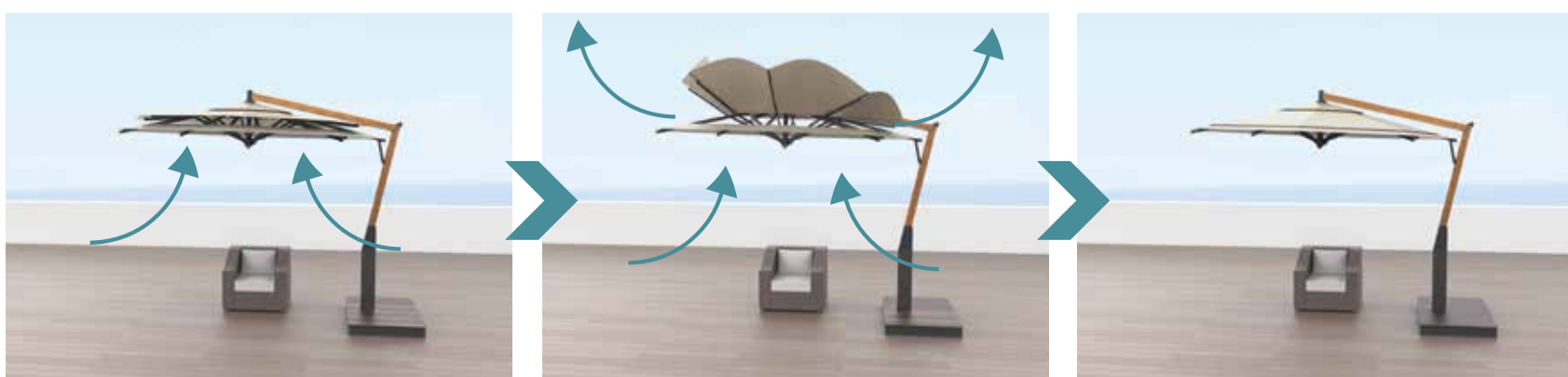
①強風が吹くと・・・ ②風抜き機構が展開し風を逃がします ③風が収まれば元の形に