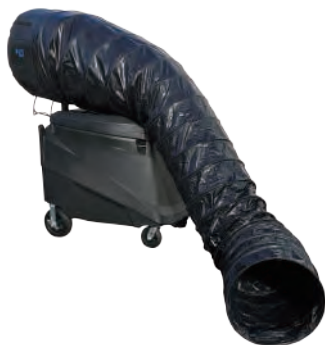
フレキシブル ダクトキット 600-039-A

ファンヘッド前面に、長さ 3.5m のダクトを取り付け、局所的に冷却することが可能です。