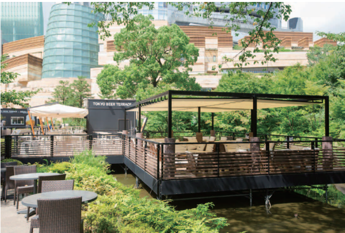
都内野外イベントにて設置された「カプリ・レーニョ」(左)と「リパーロ」(右)

上の写真は、野外イベントのテラス席に設置した「カプリ・レーニョ」(左)と「リパーロ」(右)。屋外に快適な場所を設ける傾向にある昨今の商業施設にはうってつけの商品となっている。