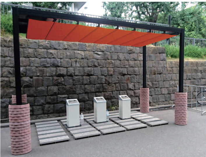
「リパーロ」による喫煙所

上の写真は、野外イベントのテラス席に設置した「カプリ・レーニョ」(左)と「リパーロ」(右)。屋外に快適な場所を設ける傾向にある昨今の商業施設にはうってつけの商品となっている。